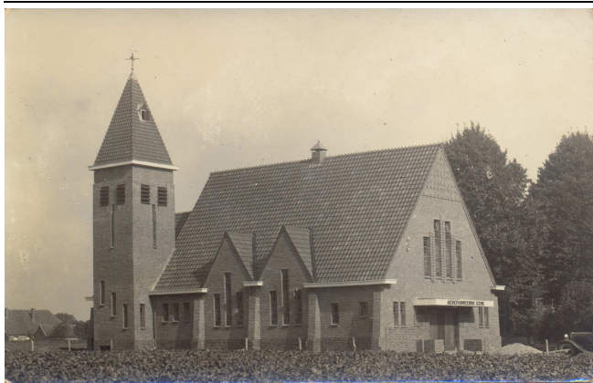
De tweede Gereformeerde kerk, 1932-1945.

landsgrens overtrok. Vijf jaar lang hebben we onder de terreur van de overweldigder moeten leven. Maar gelukkig kwamen de geallieerden ons op Goede Vrijdag 30 maart 1945 – ook weer vanaf de Dinxperloseweg – van de bezetters bevrijden! Te Bontebrug pauzeerden ze even en parkeerden ze een brandcarrier aan de westkant van de kerk... In Ulft hielden zich echter nog Duitsers op ... en vuurden er een brandbom op af ... met 't gevolg dat de kerk en de pastorie in vlammen opgingen... Slechts 12½ jaar heeft de tweede Bontebrugkerk er gestaan...