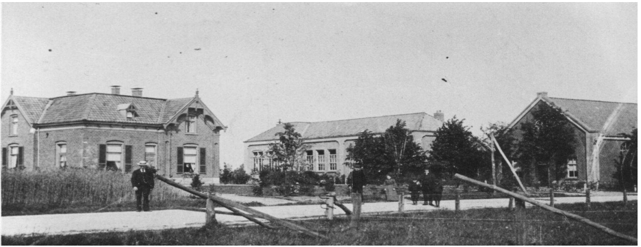
Aan de Bontebrug, circa 1920. Rechts de eerste Gereformeerde kerk van 1887. In het midden de School met den Bijbel van 1891. Links de pastorie van 1903.

len door de leden zelf verzorgd is; de meesten hunner behoorden immers tot de boerenstand en beschikten hiervoor over voldoende paarden, karren, wagens en personeel. Het werd een eenvoudig zaalkerkje met voorin een consistoriekamer (kerkenraadskamer). Totale bouwkosten: f 1085,--.