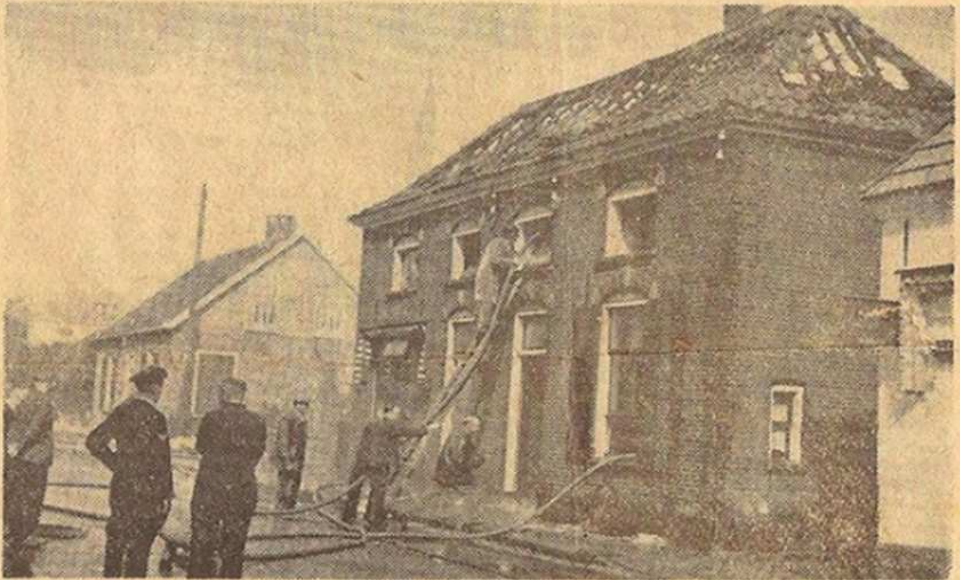
De brandweer in volle actie.

Zaterdagmiddag, precies 12 uur ontdekte de familie Jansen, wonende in de Hoofdstraat te Silvolde, brand bij hen in het bovenhuis.